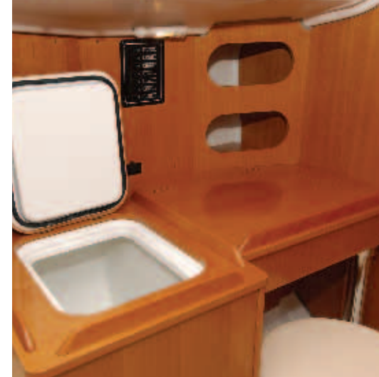
Chart table with swivel seat (pack yacht club) and insulated icebox to port.

Réchaud gaz deux feux sur cardan avec boîte à gaz (pack yacht club).