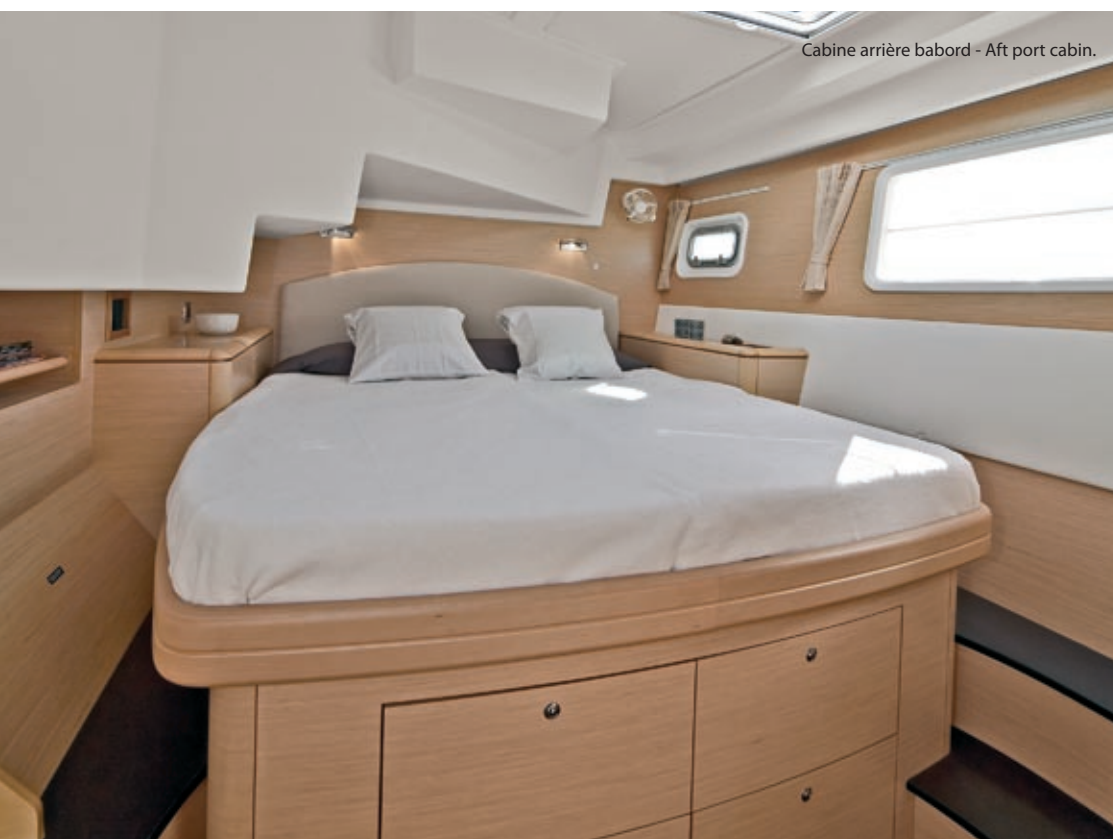
Cabine arrière babord - Aft port cabin.